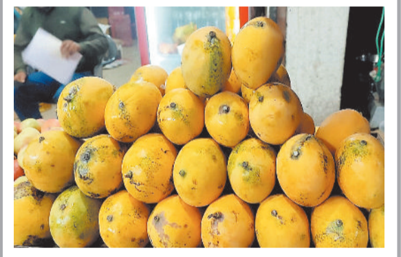
बैकुण्ठपुर। आम का मौसम अभी नहीं आया है, लेकिन अब के दौर में आम पूरे वर्ष बाजार में बिकता है फलों के बाजार में 200 रूपए किलो बे मौसम आम बिक रहा है।