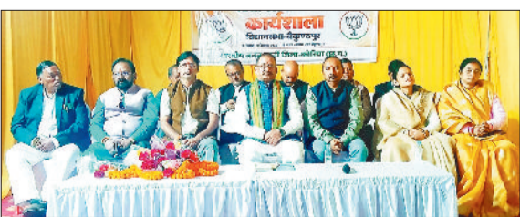
कार्यक्रम में उपस्थित अतिथि।