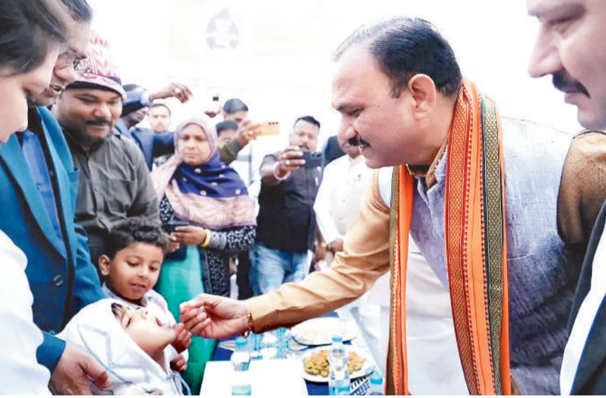
पल्स पोलियो की दवा पिलाते स्वास्थ्य मंत्री।